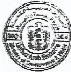
د. راشد أحمد بن فهد وزير البيئة والمياه

صدر في : 2 ربيع الثاني 1435 هـ الموافق : 2 فبراير 2014 م